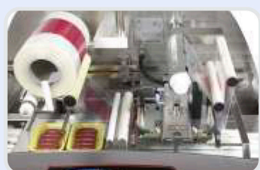
Regulagem automática de altura.